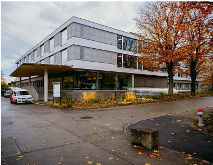
Das Wohnwerk gehört zur Schweizerischen Epilepsie-Stiftung. Das betroffene Haus befindet sich bei der Klinik Lengg.

Bis Ende Oktober war er in Spitalpflege, danach nahm ihn seine Mutter für eine Woche zu sich. Sie hofft, dass er bald in ein anderes Heim eintreten kann. Doch der Weg dorthin dürfte noch weit sein. Eine geplante Schnupperzeit in einer anderen Institution scheiterte, weil Samuels Wunden noch immer stark schmerzen. Stattdessen musste der 39-Jährige wieder ins Spital.